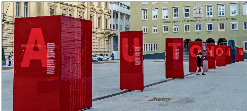
Autonomie wiederhergestellt, mit der Kompetenz Umweltschutz ausgebaut und mit einer starken Schutzklausel abgesichert.

Die Fakten vorweg: Als ersten Punkt auf der Tagesordnung des Ministerrats hat die Regierung in Rom gestern um 19 Uhr grünes Licht für das Paket zur Wiederherstellung und zum Ausbau der Autonomie gegeben. Es war eine erste Runde mit Abstimmung, auf die jetzt innerhalb von drei Wochen die – nicht bindenden Gutachten – der beiden Landtage und des Regionalrats folgen. Sind sie positiv, so entscheidet der Ministerrat kurz darauf ein zweites Mal. Diesmal endgültig